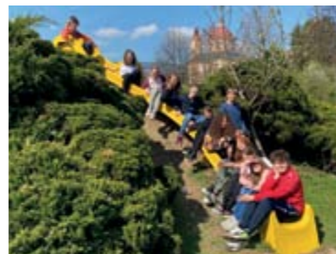
Klasse 2aK der Mittelschule Ternitz

Gleich nach den Osterferien machten sich die Schüler*innen der 2aK, 2b und 2bK der Mittelschule Ternitz auf die Reise, um im wunderschönen Pöllau in der Oststeiermark ein paar abwechslungsreiche Tage zu verbringen.