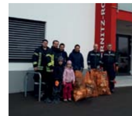
Flurreinigung in Rohrbach