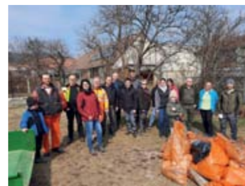
Flurreinigung in Raglitz