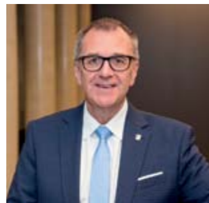
Bürgermeister Rupert Dworak

Gedruckt nach den Richtlinien des Österreichischen Umweltzeichens, UW 924