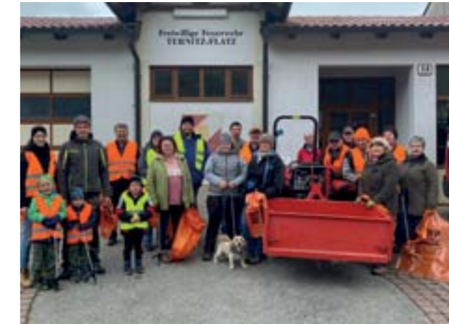
Flurreinigung in Flatz

Alle Mitbürgerinnen und Mitbürger, die sich an der diesjährigen Flurreinigung beteiligt haben, wurden von ihm zu einem Danke-Fest in das Naturparkzentrum Sieding eingeladen. Dabei nutzte er die Gelegenheit, sich auch persönlich bei allen TeilnehmerInnen zu bedanken. ■