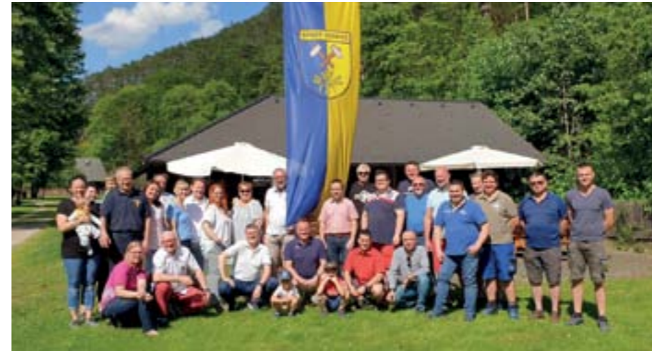
Danke-Fest in Sieding

Die Stadtgemeinde Ternitz lud die Bevölkerung, Feuerwehren und Vereine am 19. März 2021 zur traditionellen Frühjahrsreinigung in allen Ortsteilen ein.