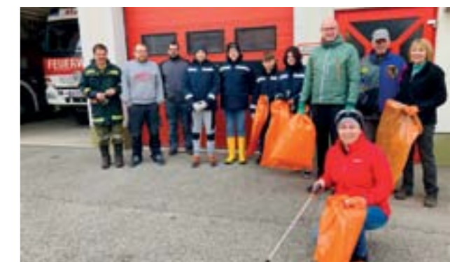
Flurreinigung in St. Johann

Alle Mitbürgerinnen und Mitbürger, die sich an der diesjährigen Flurreinigung beteiligt haben, wurden von ihm zu einem Danke-Fest in das Naturparkzentrum Sieding eingeladen. Dabei nutzte er die Gelegenheit, sich auch persönlich bei allen TeilnehmerInnen zu bedanken. ■