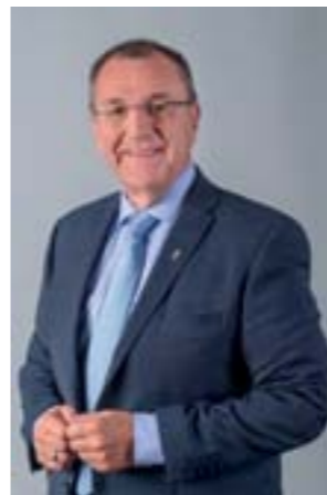
Bürgermeister Rupert Dworak