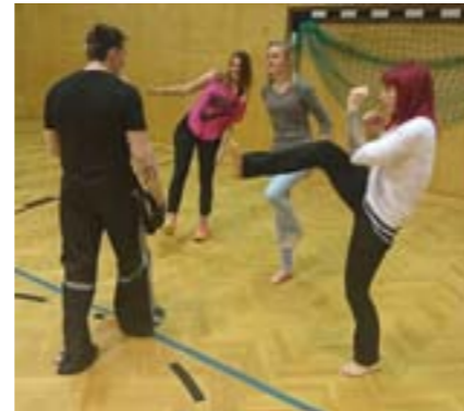
Selbstverteidigungskurs in Kooperation mit dem Verein B-Engel