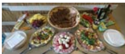
G'sunde Jausen von der Fleischerei Höller