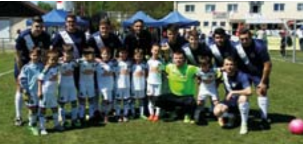
1. FZ JUZ mit U7 des SK Rapid