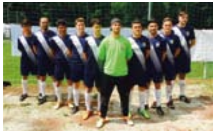
1. FZ JUZ: Erfolgreich bei zahlreichen Turnieren