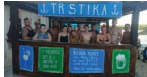
Projektwoche in Kroatien - Insel Rab