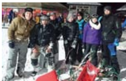
Cool Running am Zauberberg