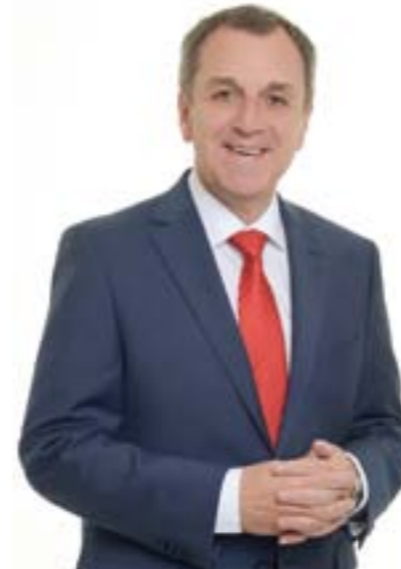
Bürgermeister LAbg. Rupert Dworak

Geschätzte Gemeindebürgerinnen, werte Gemeindebürger!