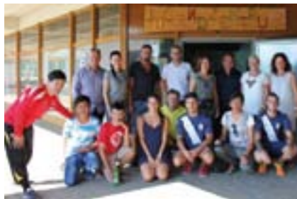
Wir feierten Jubiläum: 10 Jahre JUZ