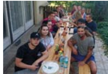
Grill & Chill am Kindlwald