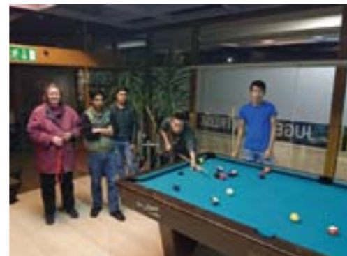
Vernetzung mit dem Samariterhaus Ternitz

Wir danken den zahlreichen Unterstützern und wünschen schöne Feiertage!