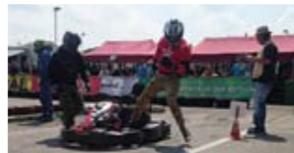
Teilnehmer beim Kart & Furious