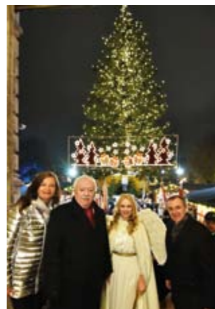
Der imposante Christbaum am Wiener Rathausplatz kommt heuer aus den Wäldern der Stadt Wien in unserer Region