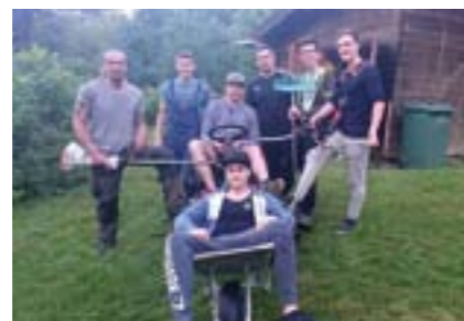
Projekt Garten am Kindlwald