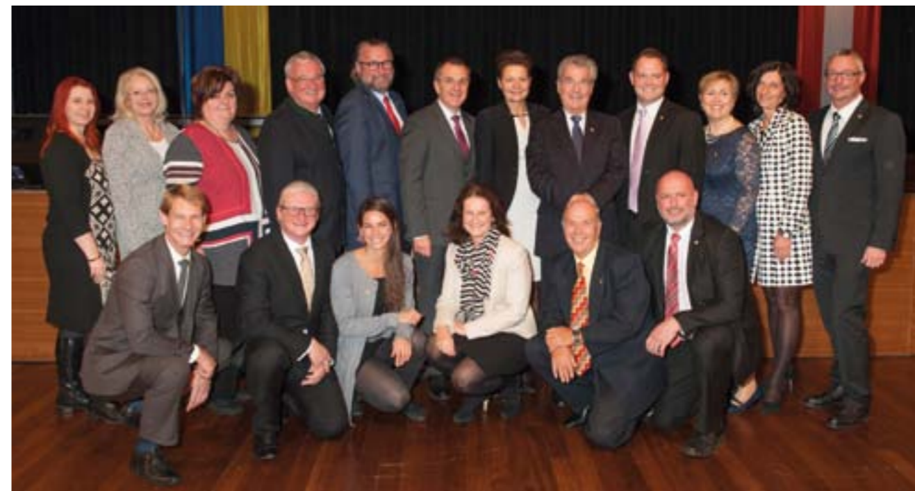
Bundespräsident a.D. Dr. Heinz Fischer mit den Vertretern der Stadtgemeinde Ternitz

despräsident außer Dienst von begeisterten Jugendlichen umlagert, beantwortete alle Fragen und erfüllte gerne jeden Fotowunsch.