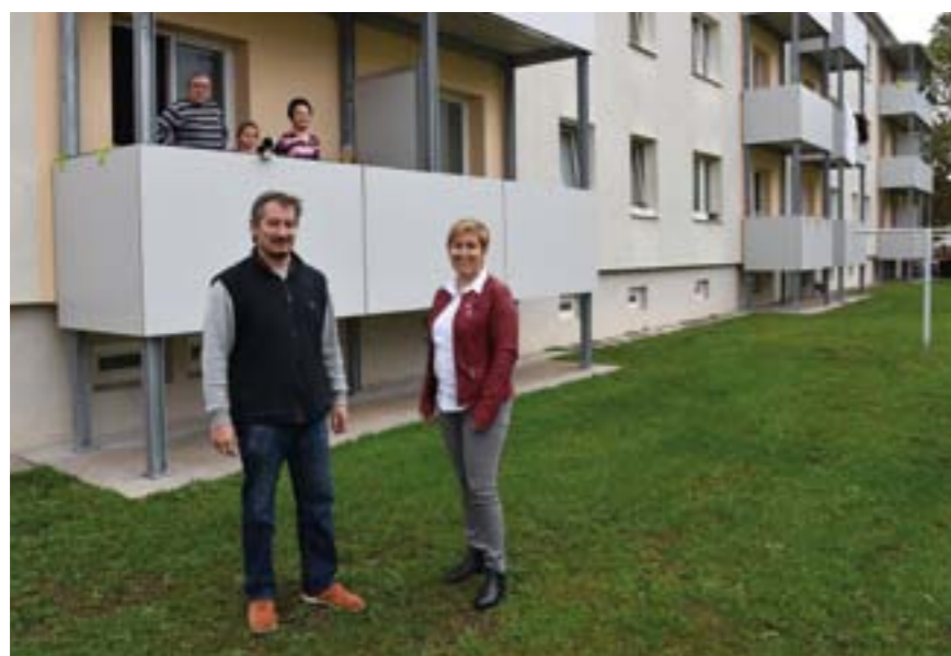
Die Bewohner der Wohnhausanlage Spiessgasse freuen sich über neue Balkone.