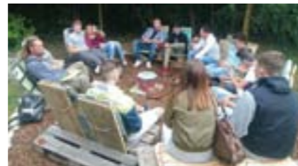
Jugendclub am Kindlwald