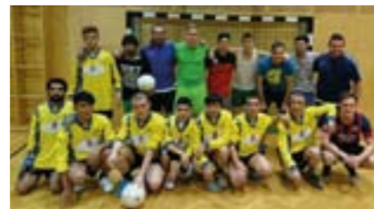
JUZ spendet Dressen an die Asylanten in Stixenstein